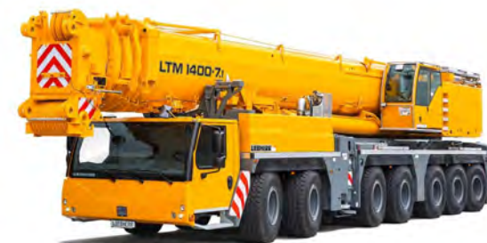
LIEBHERR LTM 1400