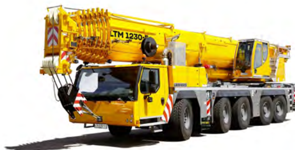
LIEBHERR LTM 1230