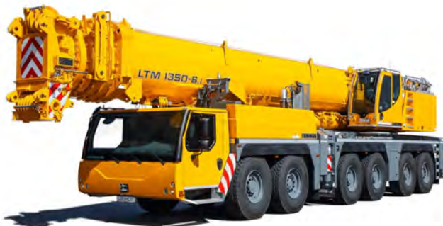
LIEBHERR LTM 1350