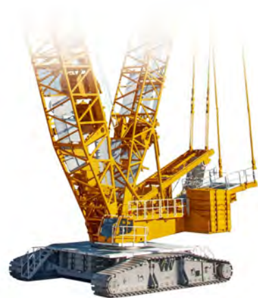
LIEBHERR LR 1750