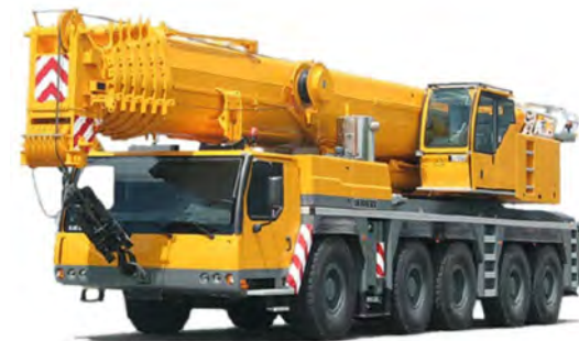
LIEBHERR LTM 1200