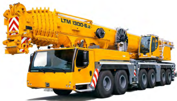
LIEBHERR LTM 1300