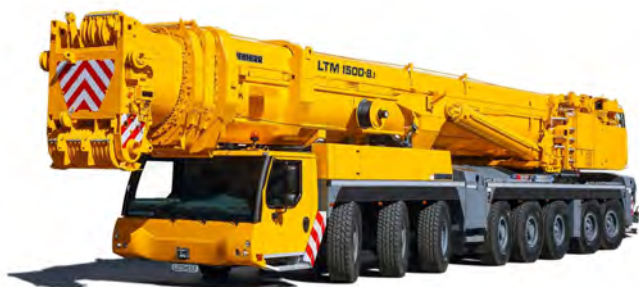
LIEBHERR LTM 1500