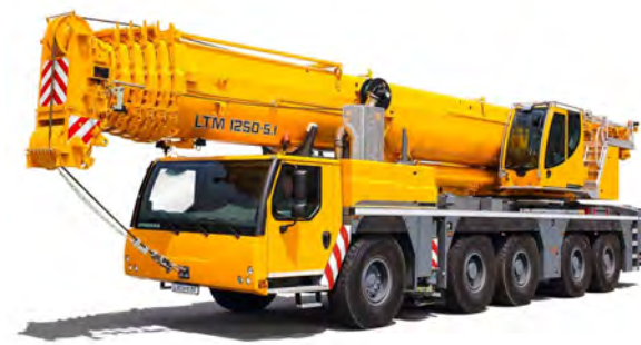
LIEBHERR LTM 1250