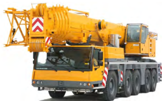
LIEBHERR LTM 1220