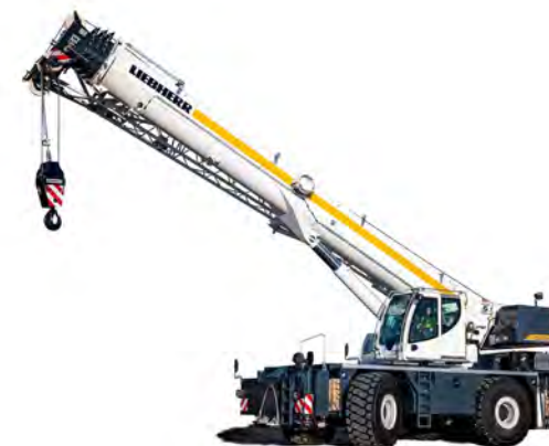
LIEBHERR LRT 1100