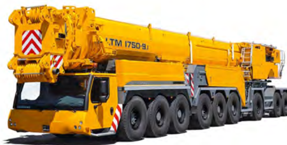
LIEBHERR LTM 1750