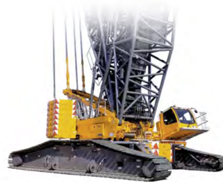
LIEBHERR LR 1600