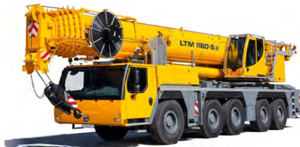
LIEBHERR LTM 1160