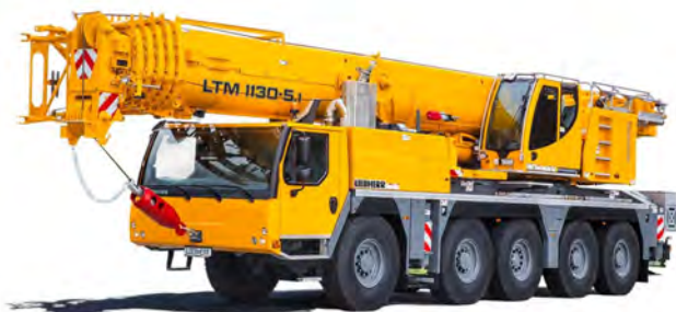
LIEBHERR LTM 1130