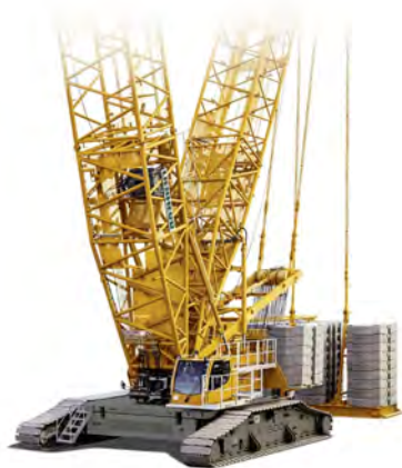
LIEBHERR LR 1500